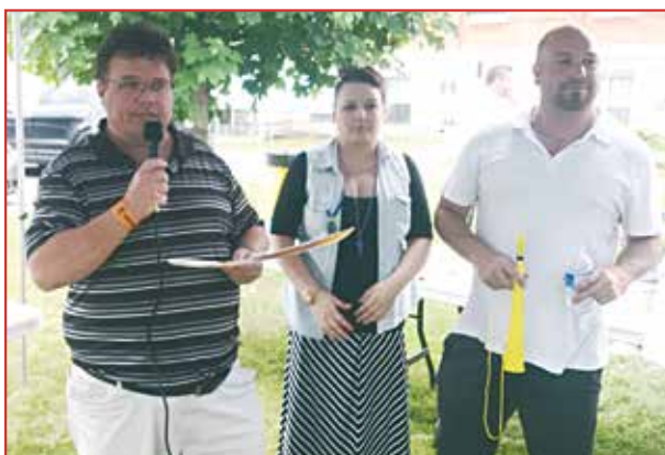
Le SPTO a dénoncé en conférence de presse les coupes qui affectent les jeunes en situation de vulnérabilité qui sont sous la responsabilité du Centre jeunesse de l'Outaouais.

Le 5 juin dernier, le SPTO-FP-CSN a organisé une conférence de presse pour dénoncer fermement les coupes qui affectent les jeunes vulnérables qui sont sous la responsabilité du Centre jeunesse de l'Outaouais. La sortie publique insistait notamment sur l'abolition du seul poste de psychoéducateur qui était l'unique référence des intervenants en cas de violence entre les jeunes ou envers le personnel. L'autre décision patronale aberrante a été d'abolir le poste des agents de relations humaines qui étaient responsables de donner un ordre de priorité aux nombreux signalements de jeunes en détresse.